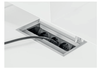
511E cable-management box with sockets passacavi con prese