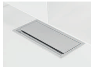
511 cable-management box passacavi