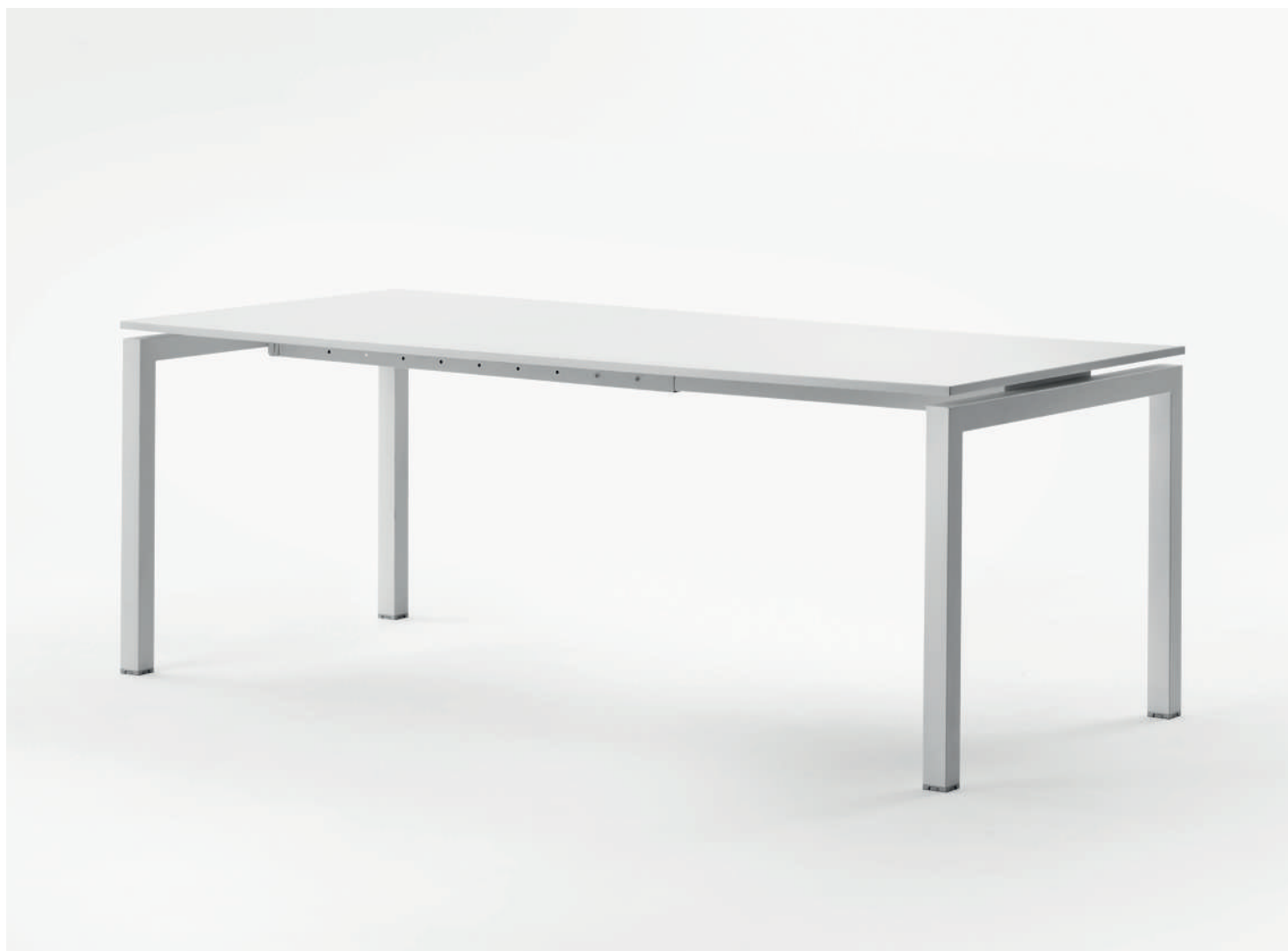
Fifty 50 (214) with powder coated frame and white laminate top. The detail of chromed version with intermediate leg and Mia upholstered armchair (3250).