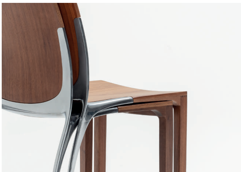
Liana Wood (4000N) in walnut and the detail of polished die-casted aluminium rear legs.