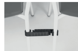
30AGN12 black polypropylene alignment links agganci allineamento in polipropilene nero