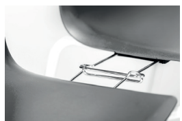
3007 alignment links (60 mm) agganci allineamento