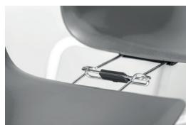
3007B block for alignment links blocco agganci