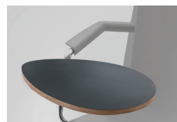
3003-3004 L armrest + multilayer tablet bracciolo + tavoletta multistrato