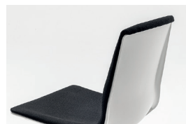
3009 upholstered shell scocca imbottita