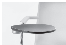
3003-3004 ABS armrest + ABS tablet bracciolo + tavoletta ABS