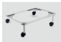
506 trolley (max 10 pcs) carrello (max 10 pcs)