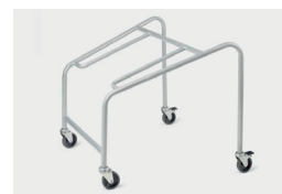
3012 trolley (max 20 pcs) carrello (max 20 pcs)