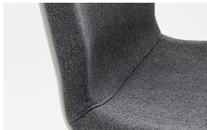
front upholstered shell scocca frontale imbottita