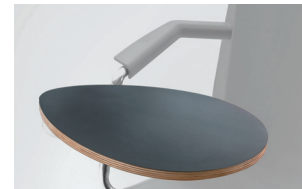
armrest + multilayer tablet bracciolo + tavoletta multistrato