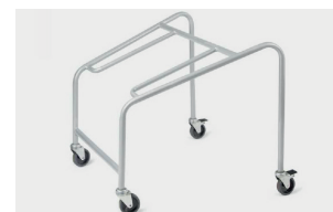
trolley (max 20 pcs) carrello