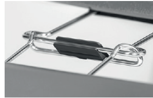
block for alignment links blocco agganci