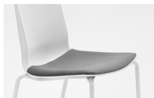
front upholstered sit seduta frontale imbottita