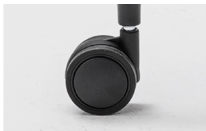
kit of 4 castors Ø 60 mm kit 4 ruote Ø 60 mm